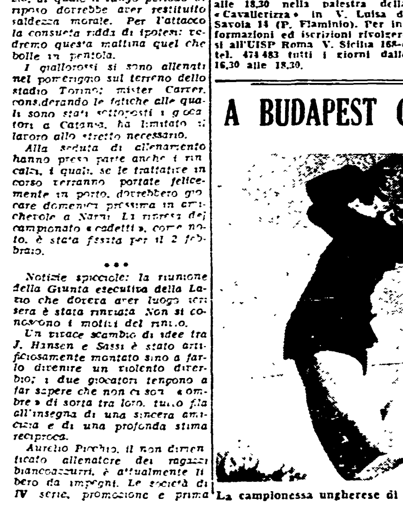
La campionessa ungherese di pattinaggio artistica Jurc Eszter