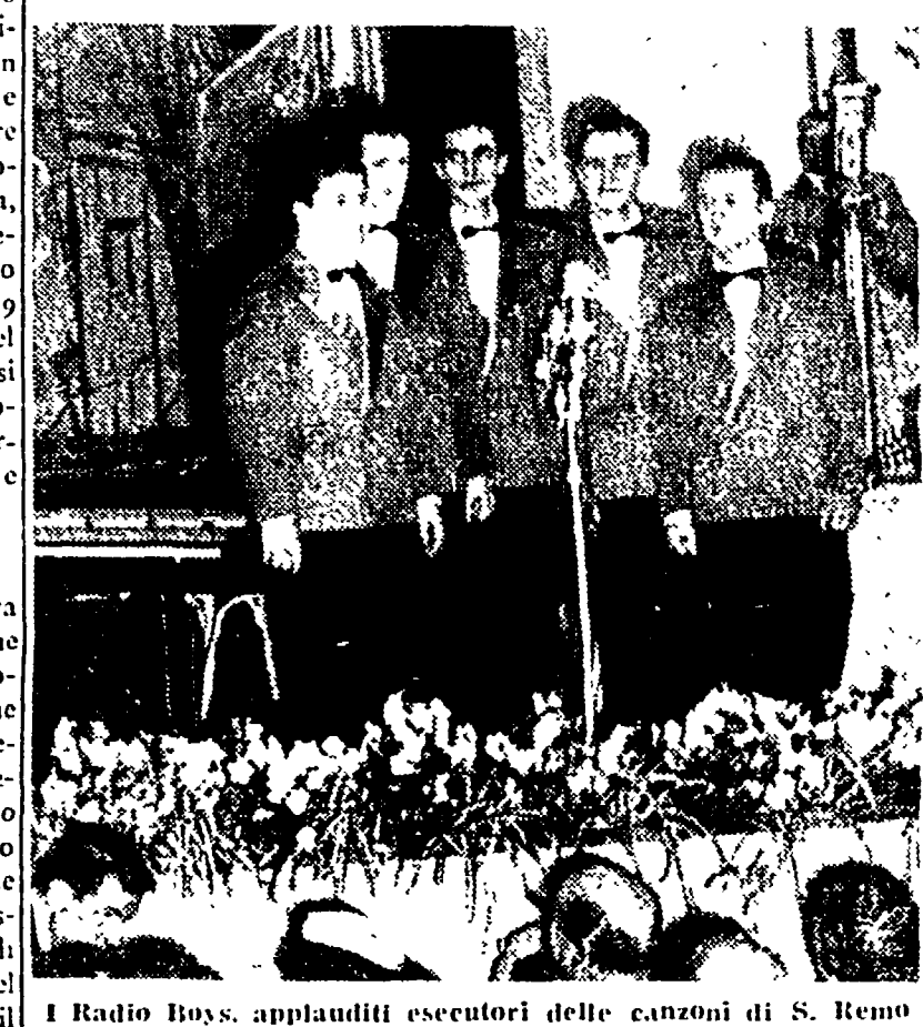
Il Radio Boys, applauditi esecutori delle canzoni di S. Remo

Il torrente - seconda e - Il canto nella valle - terza classificata - Il giudizio degli " chansonniers " francesi - Si torna a parlare di scandali - 15 mila lire un biglietto di ingresso