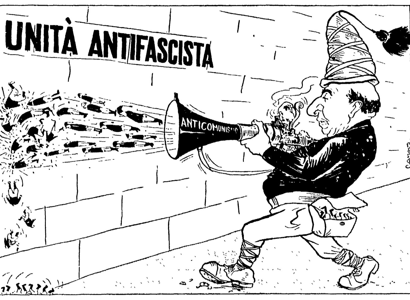
Le arrugginite armi di Scelba non potranno sgretolare il patrimonio dell'antifascismo