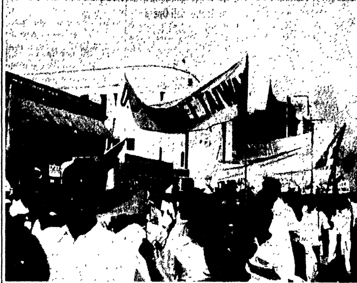
NUOVA DELHI - Manifestazioni si sono svolte in tutta l'India nella grande giornata nazionale contro l'aggressione americana a Taiwan. La foto mostra un folto gruppo di dimostranti che sfilano a Madras recando uno striscione che dice: «Americani, via le mani da Taiwan!»