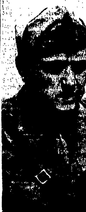
Il generale Messe

MATERA, 18. - Con una incredibile motivazione, la questura di Matera ha negato l'autorizzazione per un manifesto lanciato in occasione del congresso comunale della Lega braccianti, che si terrà domenica.