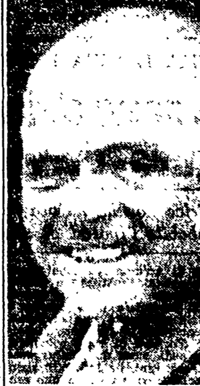
Il criminale di guerra liberato dagli occidentali, massimo responsabile delle atrocità commesse in Italia dai nazisti, Comandante della nuova Wehrmacht.

Reverbera il criminale di guerra liberato dagli occidentali, massimo responsabile delle atrocità commesse in Italia dai nazisti, Comandante della nuova Wehrmacht.