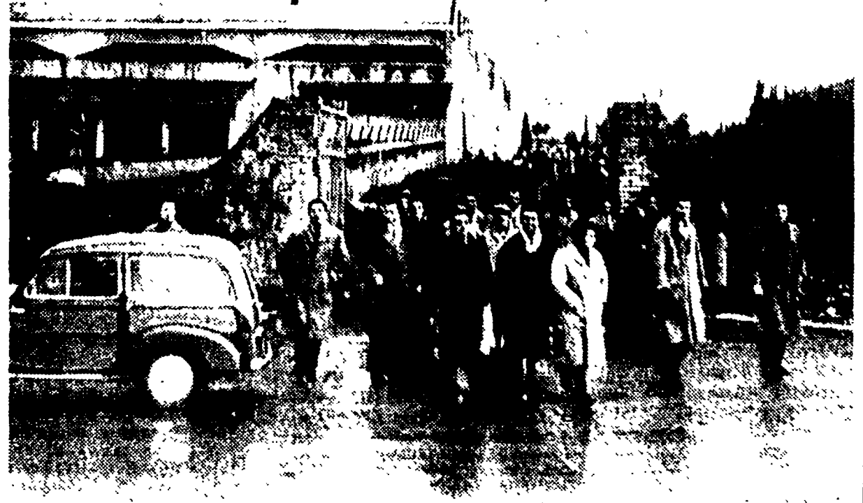
Gli operai della Fiorentina abbandonano la fabbrica per lo sciopero