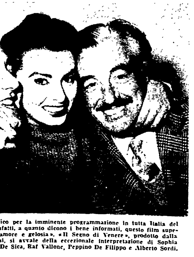
Vivissima è l'attesa del pubblico per la imminente programmazione in tutta Italia del film "Il Segno di Venere".