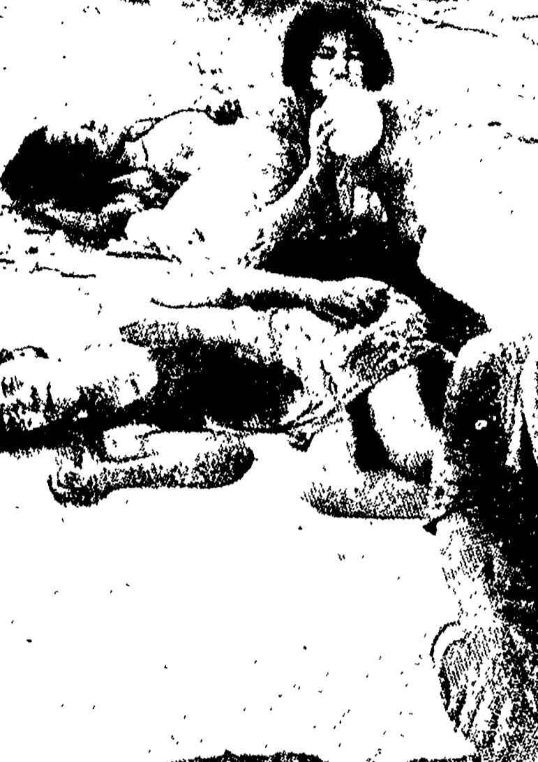
Una impressionante fotografia scattata poco dopo l'esplosione della bomba atomica su Hiroscima.