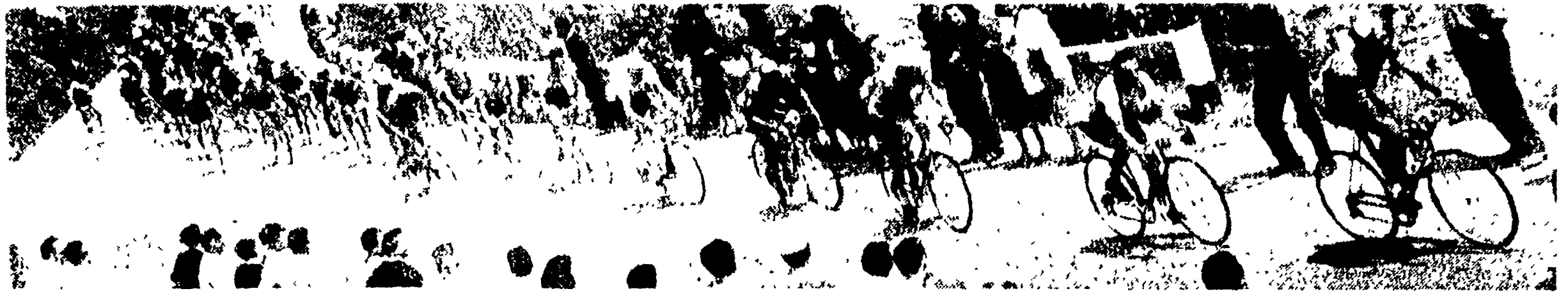
DURISSIMA SELEZIONE NELL'AVVINCENTE E DRAMMATICO GIRO DELLA CALABRIA