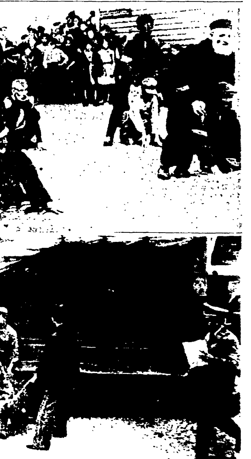
Una spietata organizzazione dei nazisti per le vie del ghetto di Lodz in Polonia; giovani ebrei costretti a correre sulle spalle dei vecchi. Sotto: si caricano i cadaveri dopo una esecuzione. Notevole nella fotografia la precisione con cui l'uomo della Gestapo registra il numero delle vittime e il sesso di ciascuna. Foto di questo genere furono stampate in un quotidiano ogni giorno...