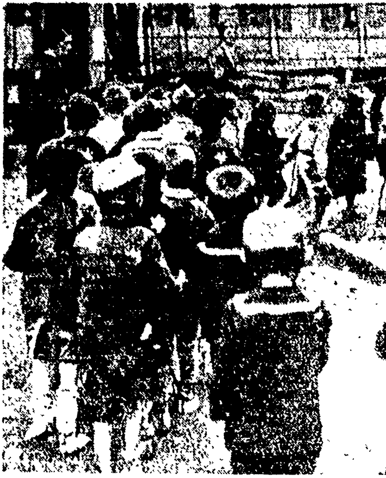
A sinistra: un bimbo ebreo di un anno, sfuggito al campo della morte di Auschwitz. Sul braccio ha marcato a fuoco il numero di riconoscimento. A destra: fanciulli ebrei diretti a un lager. Poliakoff è riferita questa testimonianza, tratta da un rapporto indirizzato a Himmler...