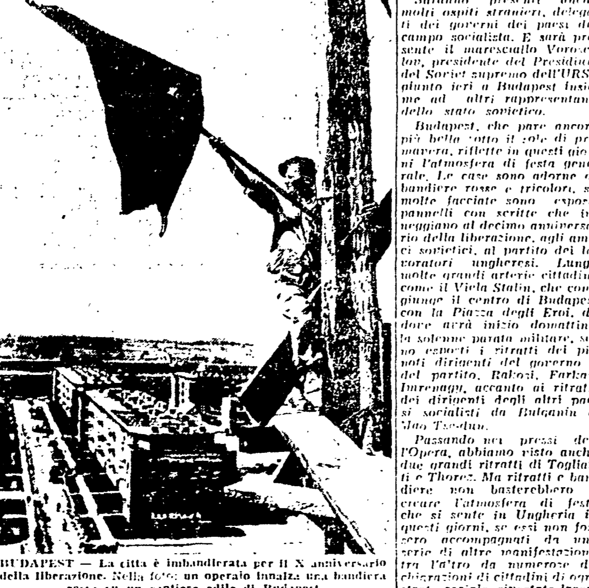
BUDAPEST — La città è imbandierata per il X anniversario della liberazione. Nella foto: un operato innalza una bandiera rossa su un cantiere edile di Budapest.

Particolarmente significativi, in proposito, è quella dei russi ungheresi, che ricordano i primi anni di vita della Repubblica ungherese, la città e i ponti distrutti, e gli ungheresi versavano il loro sangue. «Ora, in questi dieci anni — prosegue un degli relatori — non solo abbiamo visto scomparire le rovine, ma anche abbiamo ottenuto importanti risultati». I. In de costruzione del paese di oggi, ungherese, con una avanzata alla pace che i popoli unti nell'amore del lavoro e della cultura.