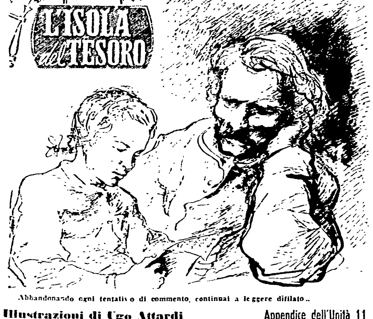
Illustrazioni di Ugo Attardi