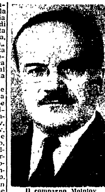
Il compagno Molotov

alcuna. Negli ambienti diplomatici occidentali, tuttavia, si afferma che un accordo completo è stato raggiunto. Il che sembra confermato dal tenore di un speciale messaggio diretto da Mosca al popolo austriaco dal cancelliere Raab.