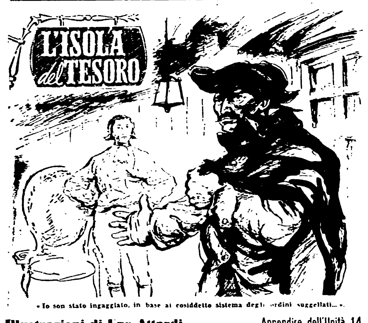
Illustrazioni di Ugo Attardi