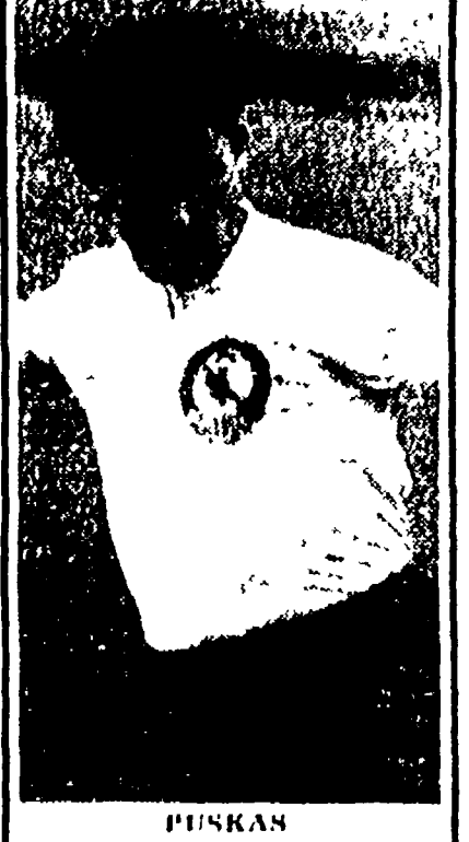
VIENNA, 21. — Al «Prater» di Vienna, gremito in ogni ordine di posti, le rappresentative calcistiche d'Austria e d'Ungheria hanno chiuso alla pari il loro centesimo confronto. La partita è stata combattuta, ed è stata eguagliata; gli ungheresi hanno confermato la loro superiorità in fatto di velocità e di forza atletica, ma gli austriaci hanno in compenso mostrato un più tenace impegno. Legato in quinta posizione il servizio all'incontro.

GENEROSA PROVA DELLA ROMA CHE CONQUISTA UNA SIGNIFICATIVA E MERITATA VITTORIA SUI ROSSONERI CONTRO UN PERICOLOSO NOVARA