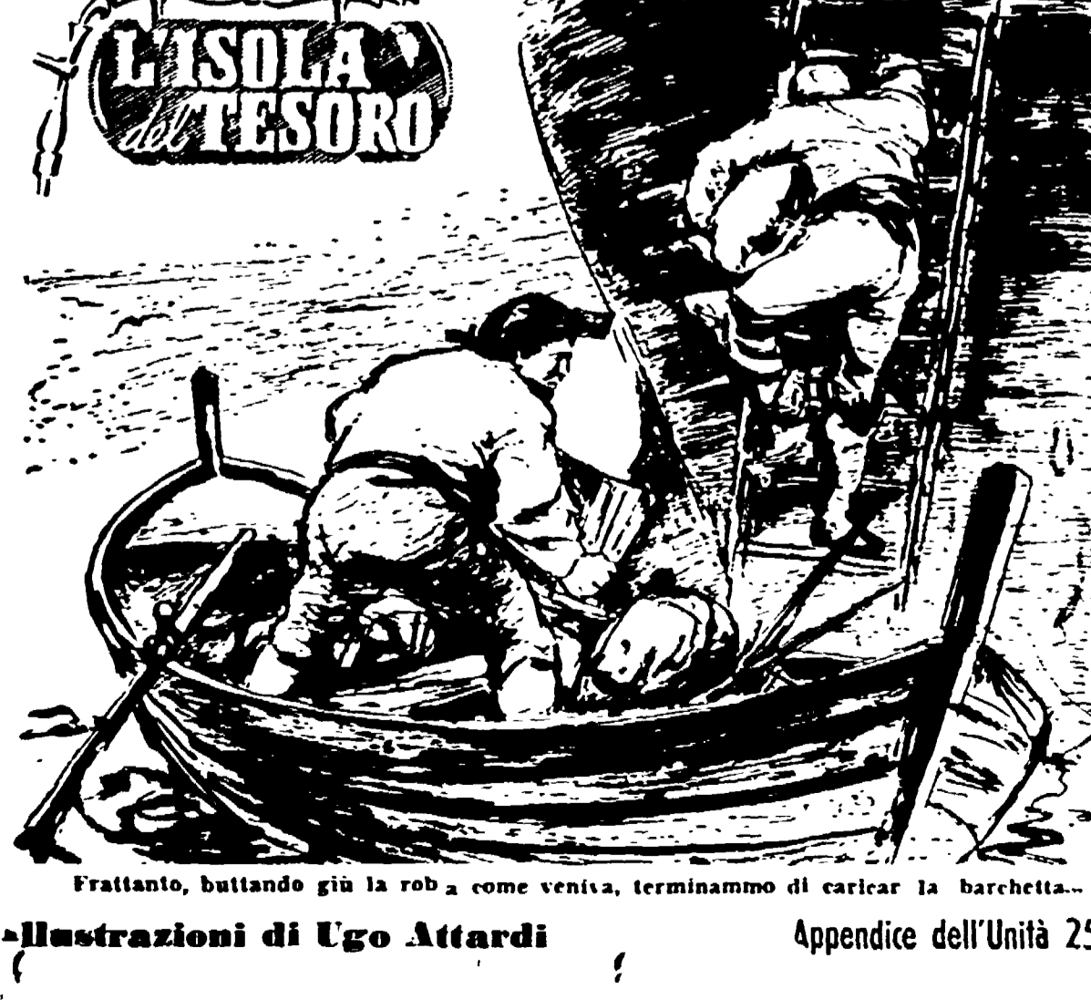
Illustrazioni di Ugo Attardi

Non c'è dubbio che il romanzo di Stevenson sia un capolavoro. Il protagonista è un uomo che si avventura in un mondo sconosciuto e che deve affrontare molte difficoltà. Il romanzo è molto avvincente e ha un ritmo molto veloce.