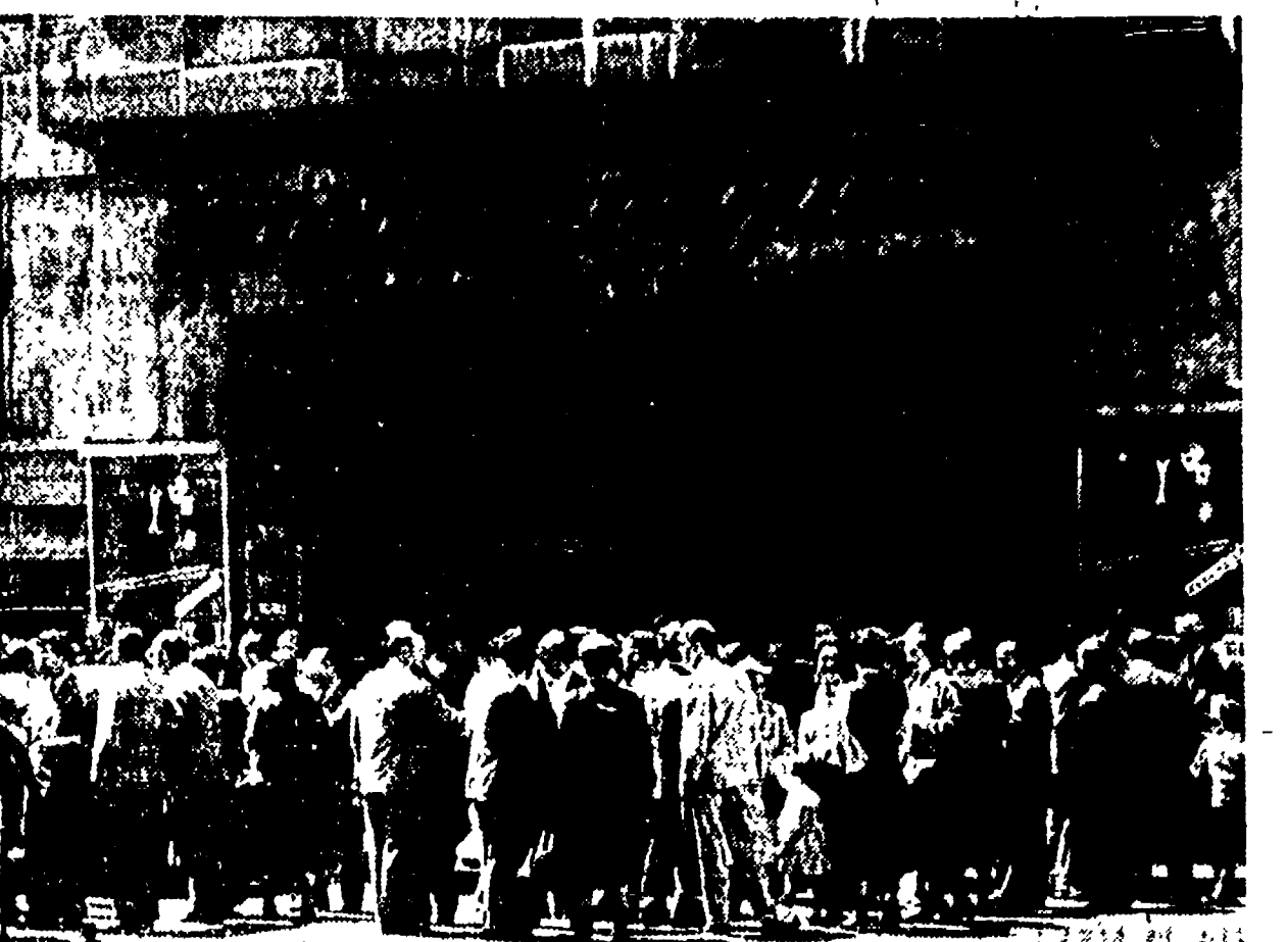
Un momento della manifestazione di ieri mattina al Cinema Aquila di Roma. I dipendenti dell'INAM, in un'atmosfera di grande entusiasmo, hanno riconfermato la loro deciso volontà di costringere il governo a concedere l'estensione dell'aumento ai parastatali...

Il ministro del Tesoro è ritornato sui suoi passi dichiarando che non ratificherà nessuna delibera e facendo esplicito divieto agli Enti di procedere al pagamento.