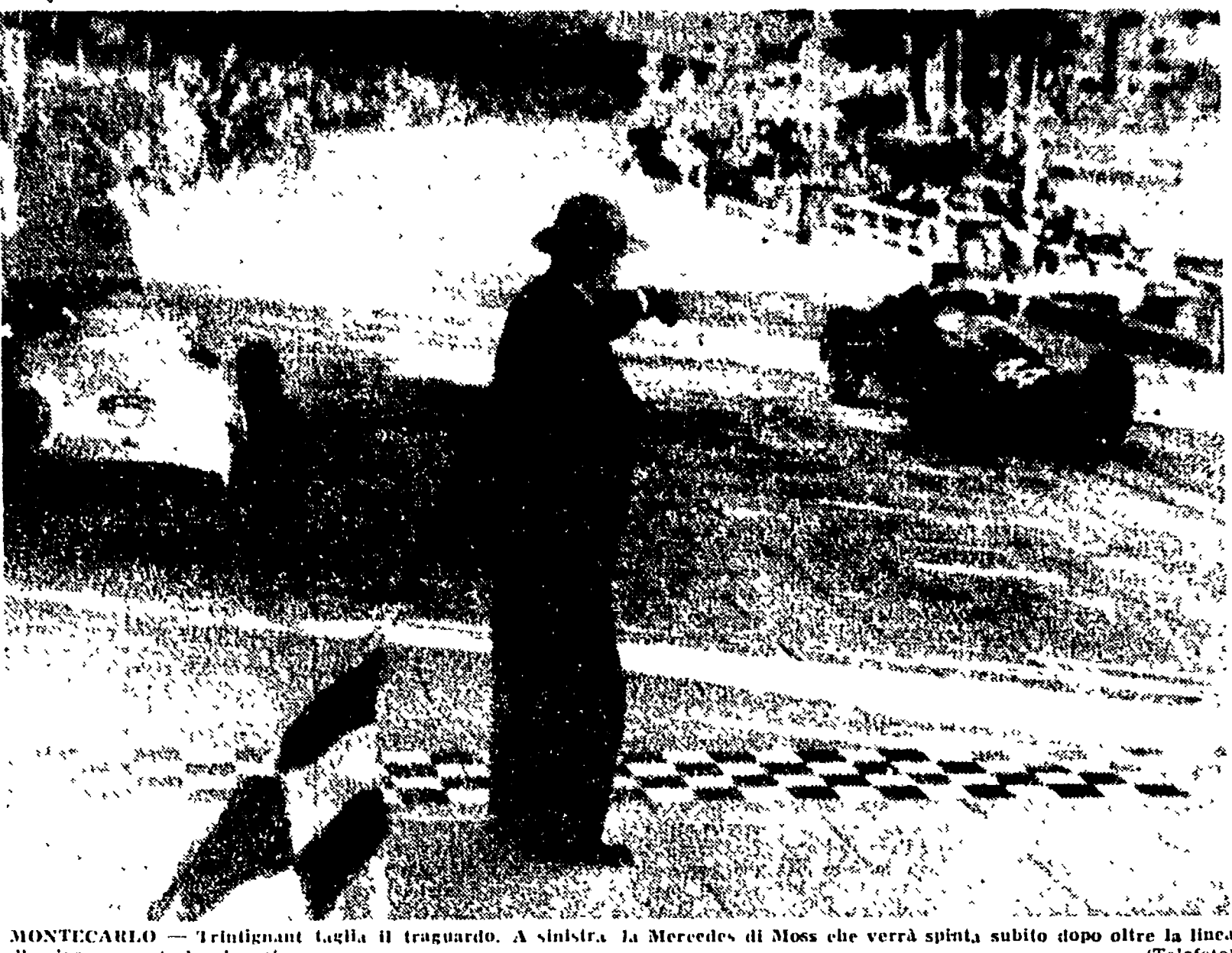
MONTECARLO — Trintignant taglia il traguardo. A sinistra la Mercedes di Moss che verrà spinta subito dopo oltre la linea d'arrivo per poterla classificare