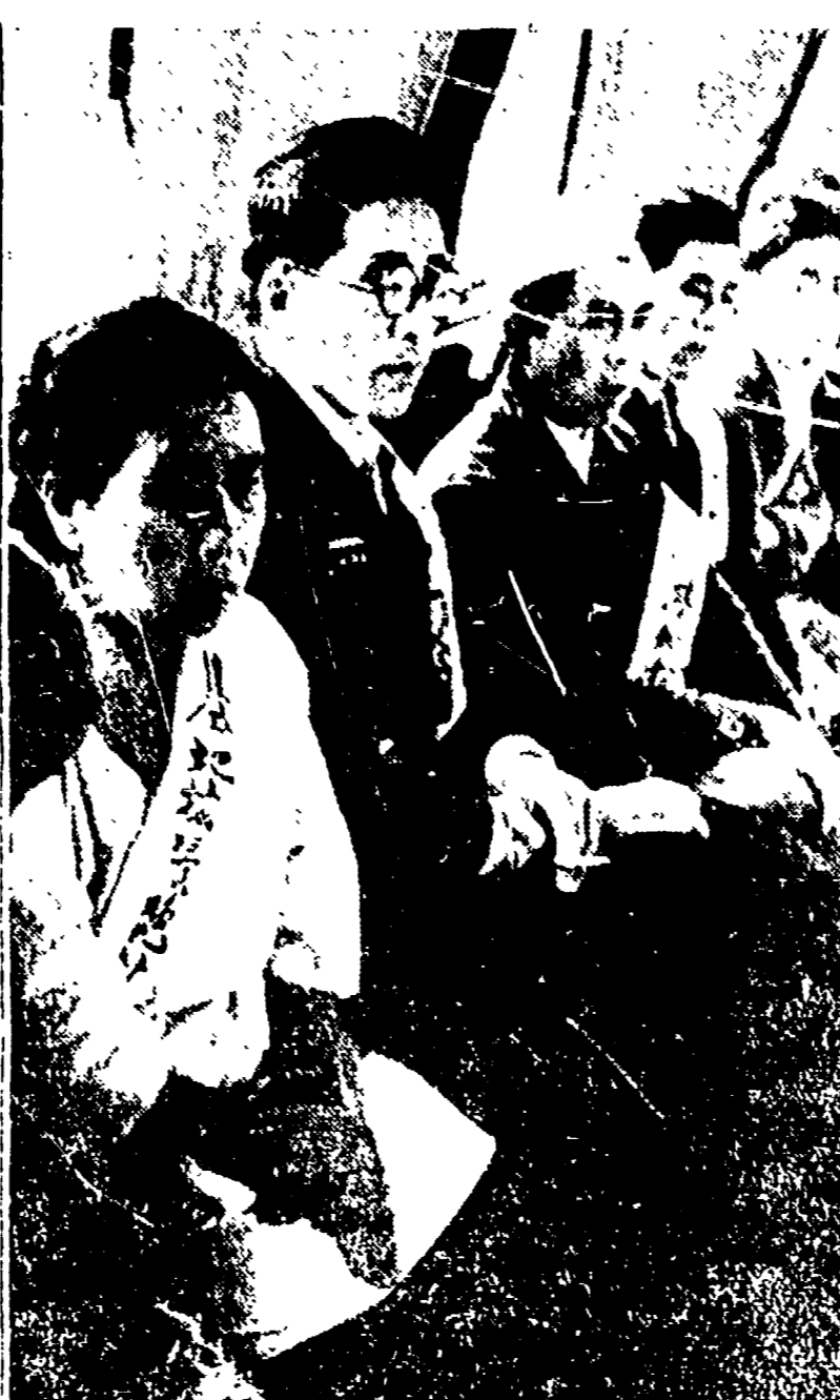
TOKIO — Una rappresentanza degli abitanti di Tachikawa, sobborgo della capitale giapponese, presenta una petizione al consiglio municipale della città contro la costruzione di una base militare americana sul territorio del loro quartiere.

«Dormire, mangiare, lavorare con tante altre donne e per la prima volta...»