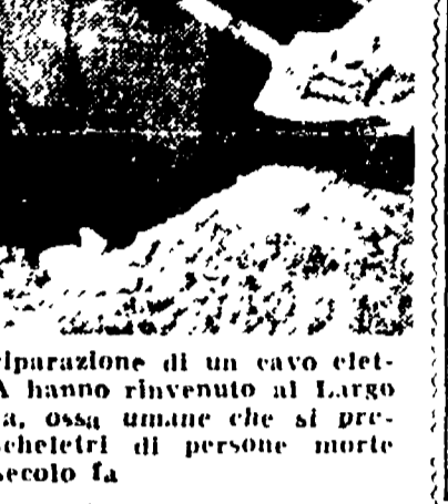
Nel corso dei lavori per la riparazione di un cavo elettrico, alcuni operai dell'ACEA hanno rinvenuto al Largo Argentina, dentro una cunicola, ossa umane che si presume appartengano a un cadavere di circa un secolo fa.