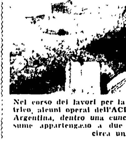
Nel corso dei lavori per la riparazione di un cavo elettrico, alcuni operai dell'ACEA hanno rinvenuto al Largo Argentina, dentro una cunicola, ossa umane che si presume appartengano a un cadavere di circa un secolo fa.