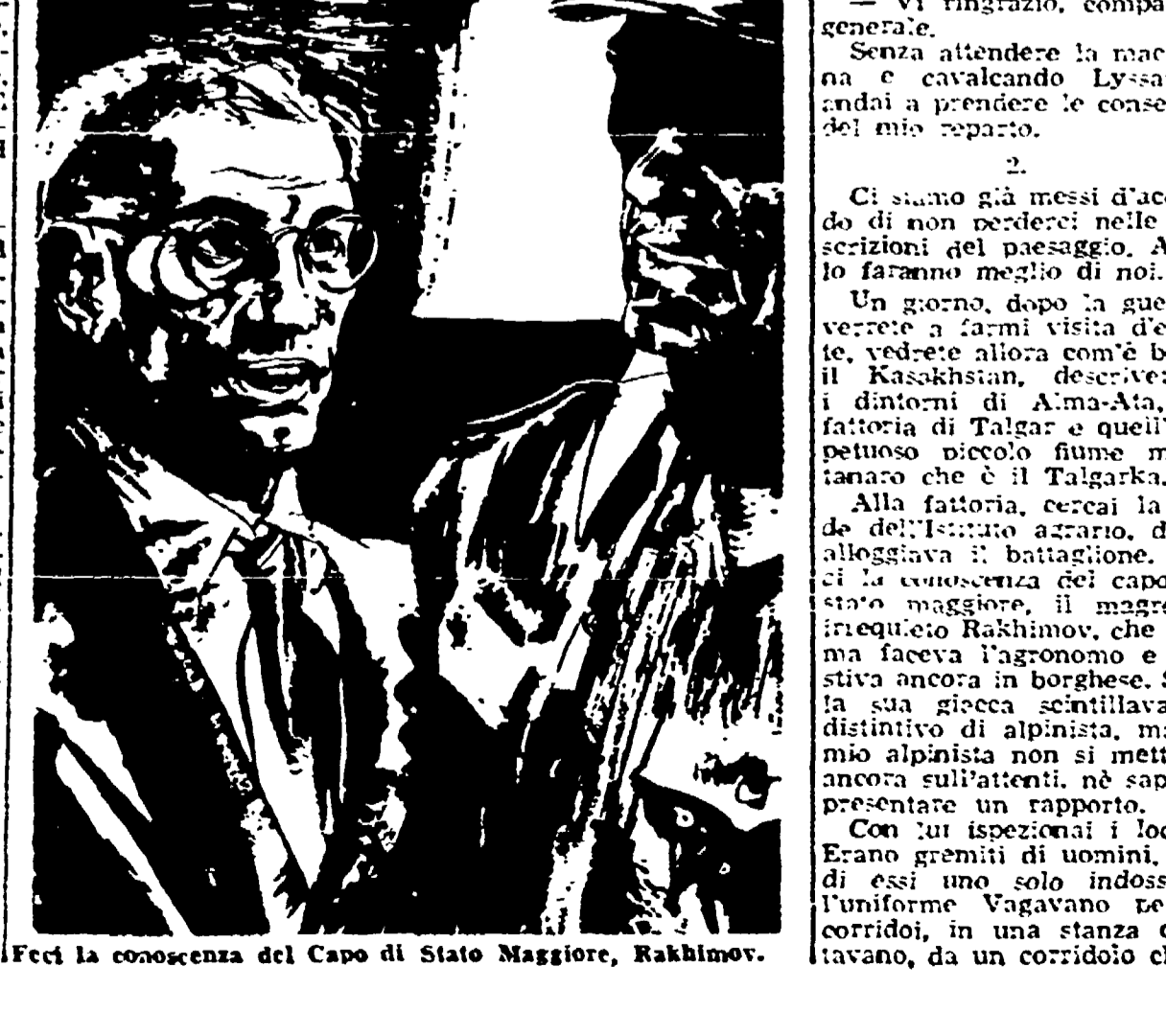
Fede la conoscenza del Capo di Stato Maggiore, Rakhimov.