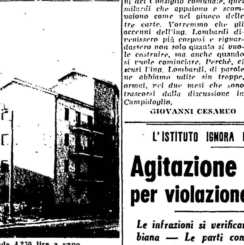
Per questi nuovi alloggi gli alla Garbatella, l'I.C.P. chiede 4.250 lire a vano

mettersi sulla scia degli speculatori privati. Come ho già spiegato più volte, anche a ridurre il costo giornaliero, non in sede pubblica del Consiglio Comunale, le pignoni di questi alloggi (in verità lire 4.250 a vano) sono sostanzialmente superiori a quelle delle altre case amministrate da questo Istituto perché si tratta di costruzioni che non sono assistite da alcun contributo statale.