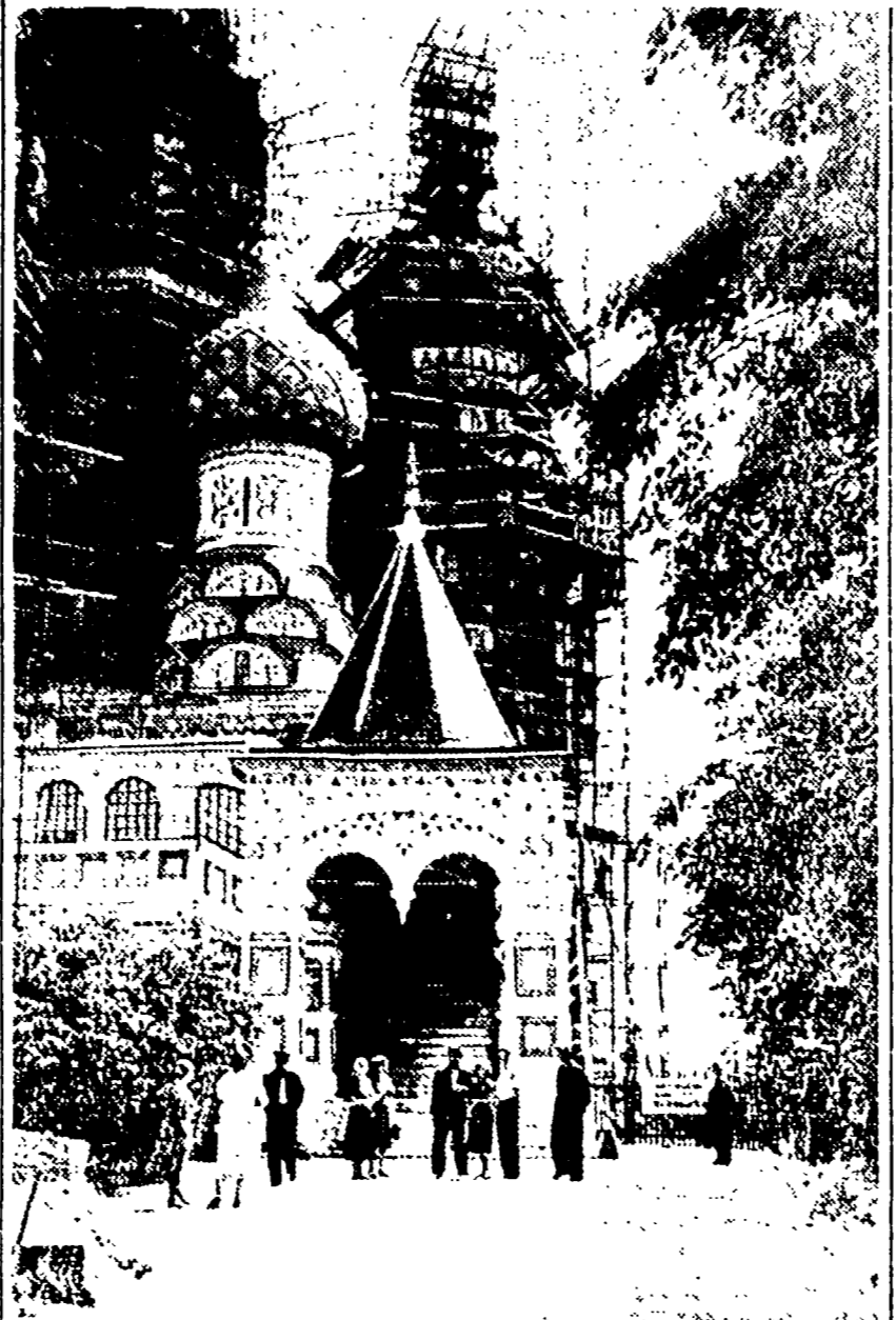
MOSCA — Una fitta intelaiatura di tubi metallici è sorta attorno alla chiesa di San Basilio, sulla Piazza Rossa. Pittori, architetti, stori dell'arte, doratori e scultori vi avvengono sulle impalcature per procedere ai difficili lavori di restauro del famoso monumento dell'antica arte russa...