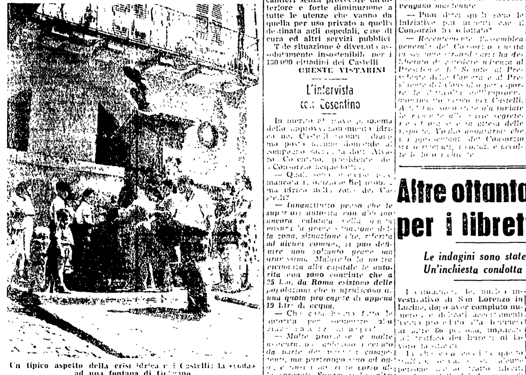
Un tipico aspetto della crisi idrica nei Castelli: la scorta di acqua è in esaurimento.

Si vanno svolgendo in tutti i centri dei Castelli romani numerose assemblee di cittadini che chiedono una rapida soluzione del problema idrico della zona. Circa otto mesi fa cominciammo da questo punto di vista la situazione idrica inopportuna venuta a crearsi in vari comuni dei Castelli romani per la insufficienza di acqua dovuta alla costante diminuzione delle sorgenti di acqua.