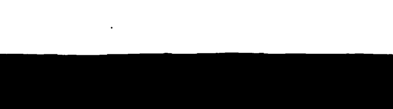
Ufficiali della polizia o carabinieri.