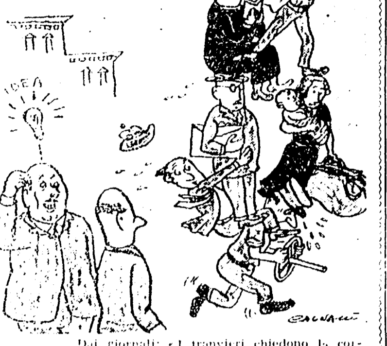
REDECCHINI: A tutto c'è rimedio. I tranvieri si lamentano? Perbacco, aumentiamo le tariffe!