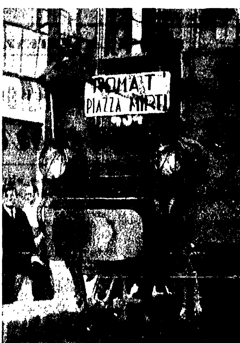
Sulle vie della Capitale è frequente la visione di messi antidiluviani come questa vettura della STEFER.

Domani la manifestazione opera dell'edilizia — La Bonaiti e il commercio delle aree — Velenoso atteggiamento della stampa governativa — Unanimi aspirazioni della cittadinanza.