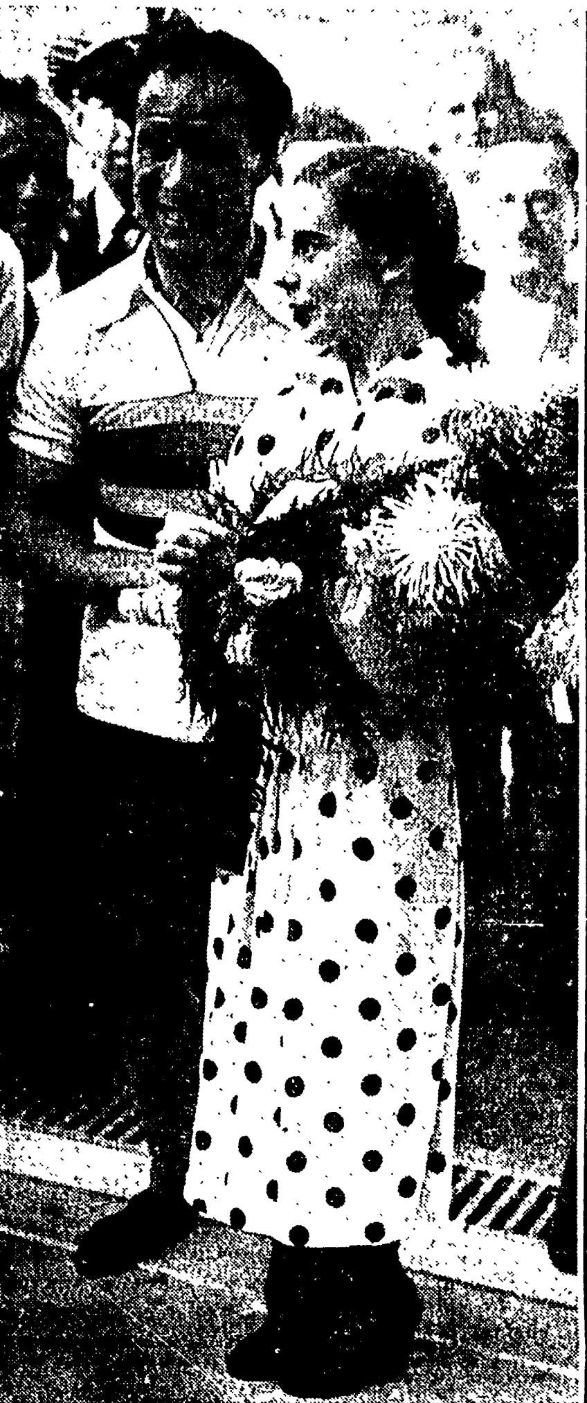
MANCHESTER, 22 — Reg. Harris, il velocista professionista britannico, non potrà difendere il titolo di campione di velocità al campionato mondiale che si svolgerà a Milano la prossima settimana. Come è noto, Harris si è slogato una spalla mentre si allenava su un velodromo di Copenhagen sabato scorso. Il corridore britannico è stato trasportato direttamente all'ospedale, dove uno specialista lo ha visitato. Alla fine della visita, il medico ha dichiarato che Harris dovrà rimanere a riposo almeno per tre settimane.