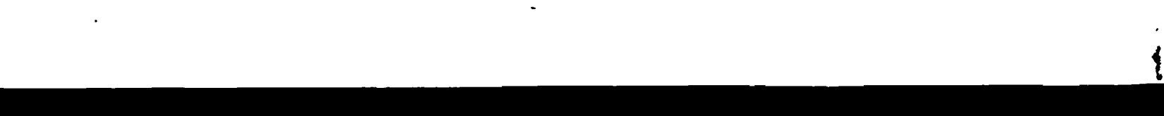
Il profilo altimetrico del circuito dei campionati mondiali di ciclismo

L'Automobile Club di Roma - d'accordo con le autorità competenti e con l'Unione Ciclistica Italiana - ha predisposto speciali servizi di posteggi per automobili e moto nella città di Frascati.