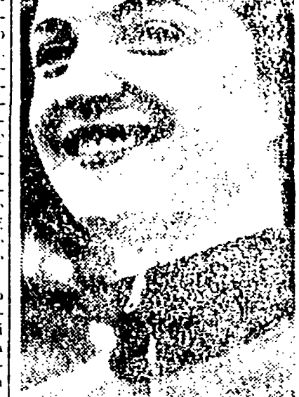
L'AZZURRA BIANCHI, ACCOGLIENDO IL VANTAGGIO MORALE DELLA RASSEGNA