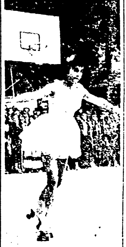
Il pattinatore e uno degli sport più curati dall'U.I.S.P.