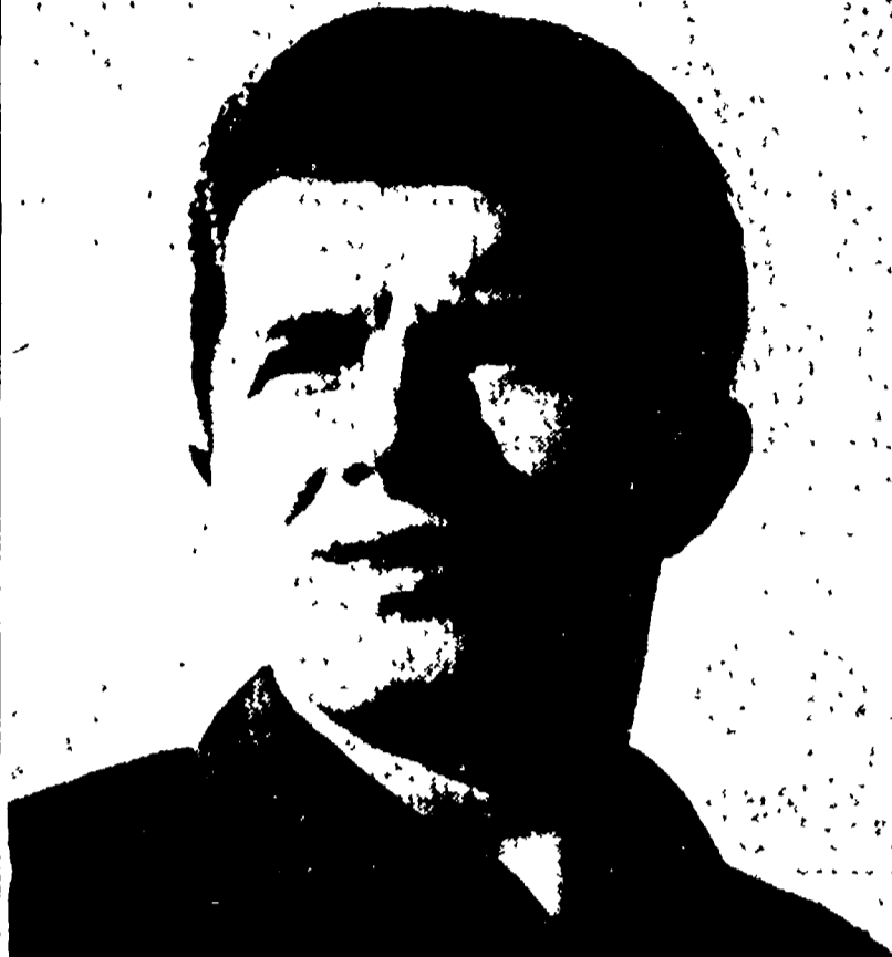
Con i due goal realizzati a Genova il giallorosso NYERS è balzato al comando della classifica dei cannonieri con quattro reti. Seguono con tre reti Schiaffino, Nordahl, Fioravanti, con 2 reti Brugola, Vairo, Vitale, Selmooson, Longoni, Campagnoli, Frotto, Mariani, Fabbri e con una Armano, Bacci, Celio, Conti, Costa, Danova, Frizzi, Galli, Juliano, La Forgia, Orzan, Pellis, Virgili, Zorzin, Boniperti, Cervellini, Pandolfini, Fonda, Bettini, Rasmussen, Dalmonico, Feccia, Macor, Sala, Antoninotti, Passarin.