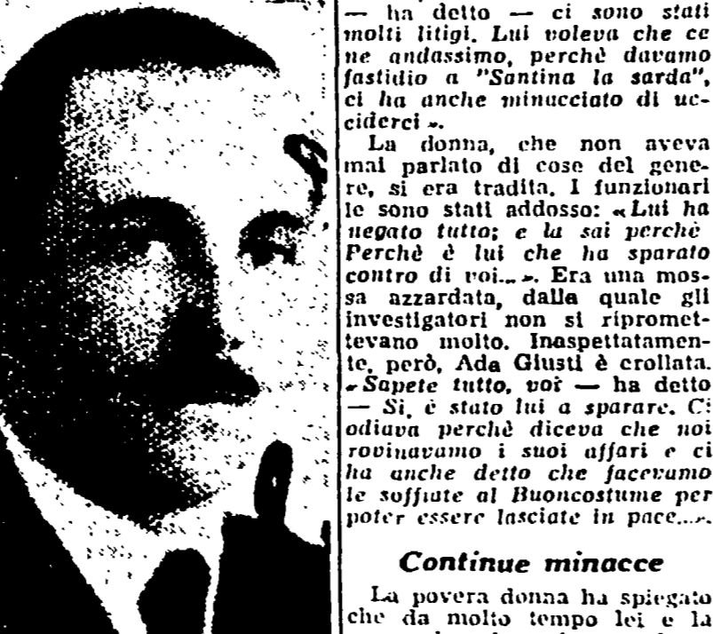
Il barbiere di Via Casilina

Da molte ore un uomo sulla piazza Vittorio, della quale erano stati protetti i due cadaveri, ha indicato in un losco "protettore", l'assassino della mondana Giuseppina Babbanini. Da molte ore un uomo sulla piazza Vittorio, della quale erano stati protetti i due cadaveri, ha indicato in un losco "protettore", l'assassino della mondana Giuseppina Babbanini.