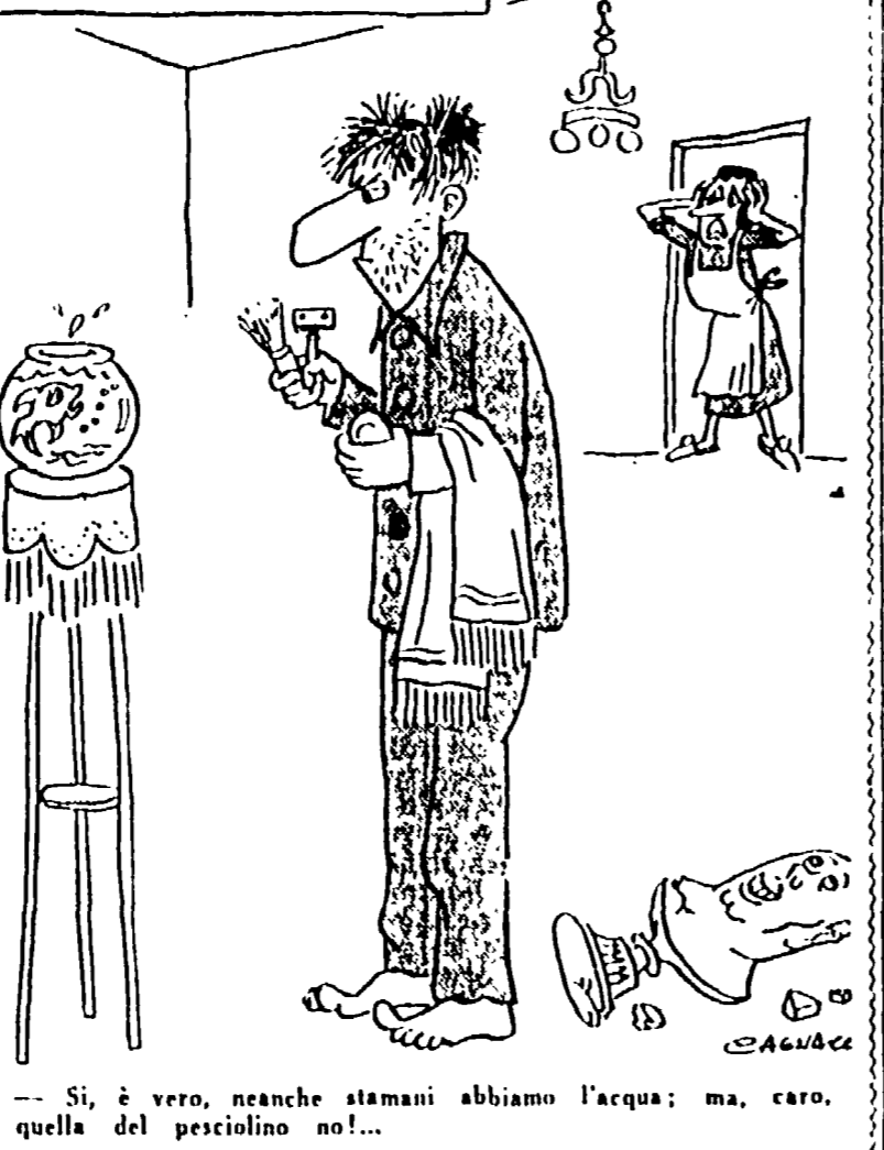
— Sì, è vero, neanche stamattina abbiamo l'acqua; ma, caro, quella del pesciolino no!