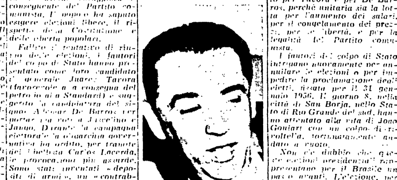
Juscelino Kubitschek.