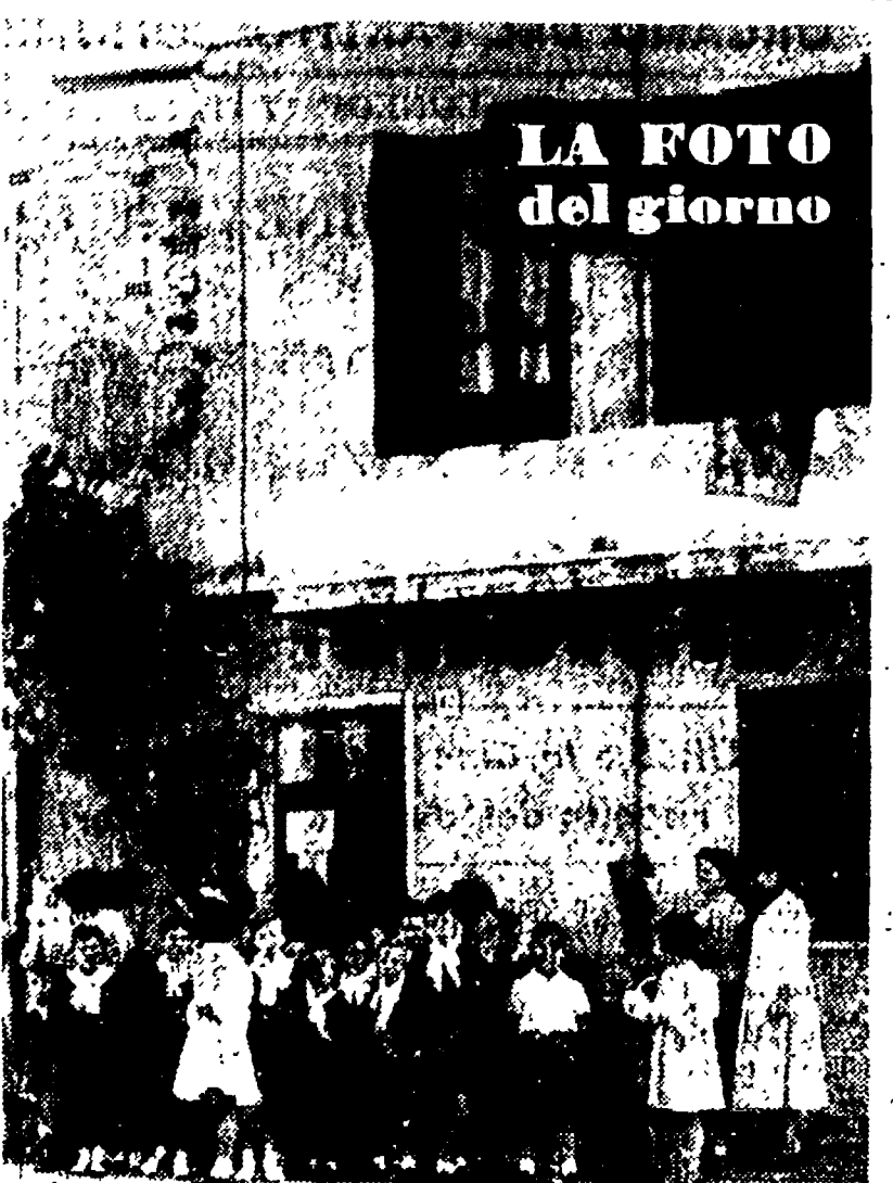
LA FOTO del giorno

Gli abitanti della borgata di Pietralata attendevano con una punta di curiosità l'arrivo del commissario dell'ufficio di polizia di S. Apollinare, un ufficiale di carabinieri e una decina di sottufficiali di polizia, oltre a una cinquantina di agenti e militi. A dar man forte ai carabinieri e poliziotti sono arrivati anche i vigili urbani con il compito di far «circolare» i curiosi e di far marciare a passo d'uomo le macchine dirette al Tiburtino di quando in quando. Le curiosità, però, non manarono che all'arrivo dell'onorevole Fanfani, segretario del partito governativo, che si presentò in un'auto privata, con un discusso seguito di agenti e militi. A dar man forte ai carabinieri e poliziotti sono arrivati anche i vigili urbani con il compito di far «circolare» i curiosi e di far marciare a passo d'uomo le macchine dirette al Tiburtino di quando in quando. Le curiosità, però, non manarono che all'arrivo dell'onorevole Fanfani, segretario del partito governativo, che si presentò in un'auto privata, con un discusso seguito di agenti e militi. A dar man forte ai carabinieri e poliziotti sono arrivati anche i vigili urbani con il compito di far «circolare» i curiosi e di far marciare a passo d'uomo le macchine dirette al Tiburtino di quando in quando.