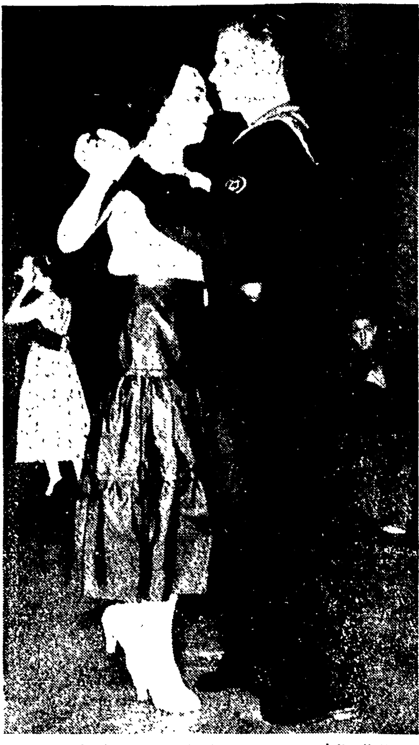
INGHILTERRA - Durante la permanenza della flotta a Portsmouth, ufficiali e marinai sovietici hanno partecipato a una serata danzante indetta in loro onore.