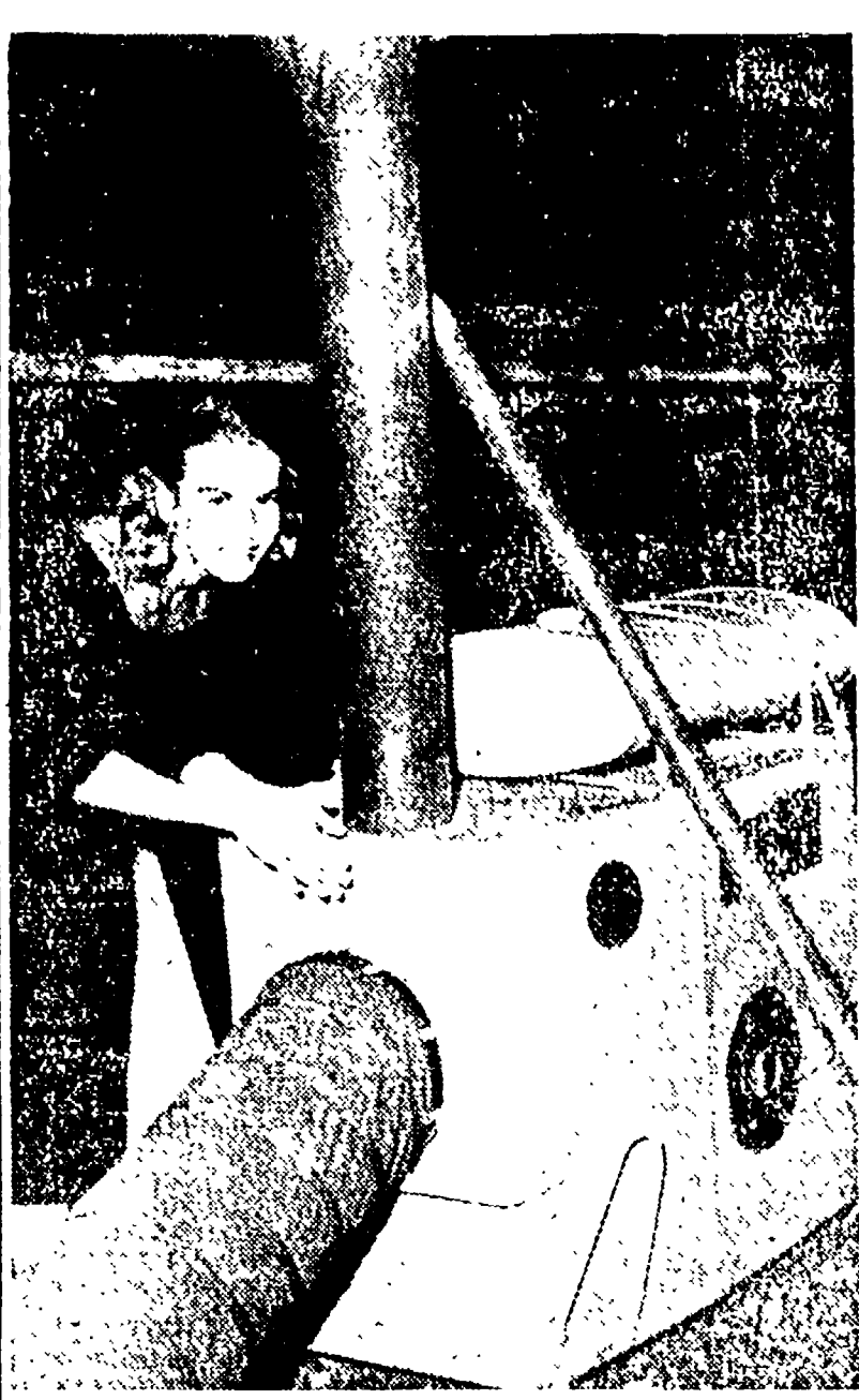
PARIGI — Alla vigilia dell'inverno, un nuovo sistema per il riscaldamento dei locali è in via di sperimentazione...