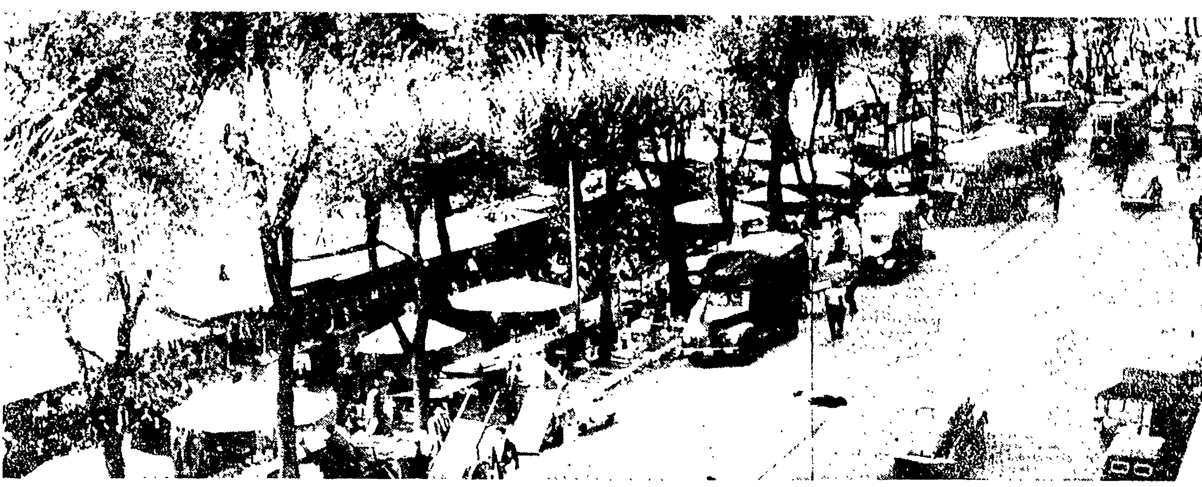
Piazza Vittorio costituisce uno dei principali empori della Capitale. In esso confluiscono, per fare la spesa quotidiana, non solo le donne dell'Esquilino, ma le masse di altri quartieri e specialmente delle borgate. Oggi, al mercato di piazza Vittorio si contano 240 banchi di frutta e verdura, 11 di cicerchia ed oliori, 21 di carne bovina e frattaglie, 29 di abbacchi e polli, 33 di pesce, 6 di frutta di mare, 27 di pizzercheria, 10 di uova e polli vivi, 4 di olive, 6 di pasta, un banco di frutta secca, 3 di sementi, 12 di lunghi, ecc. Decine di altri banchi smerciano articoli di abbigliamento, domestici e vari. Compresi i banchi che fanno corona alla piazza, dilocali un po' qua e là, si contano circa seicentocinquanta rivenditori.