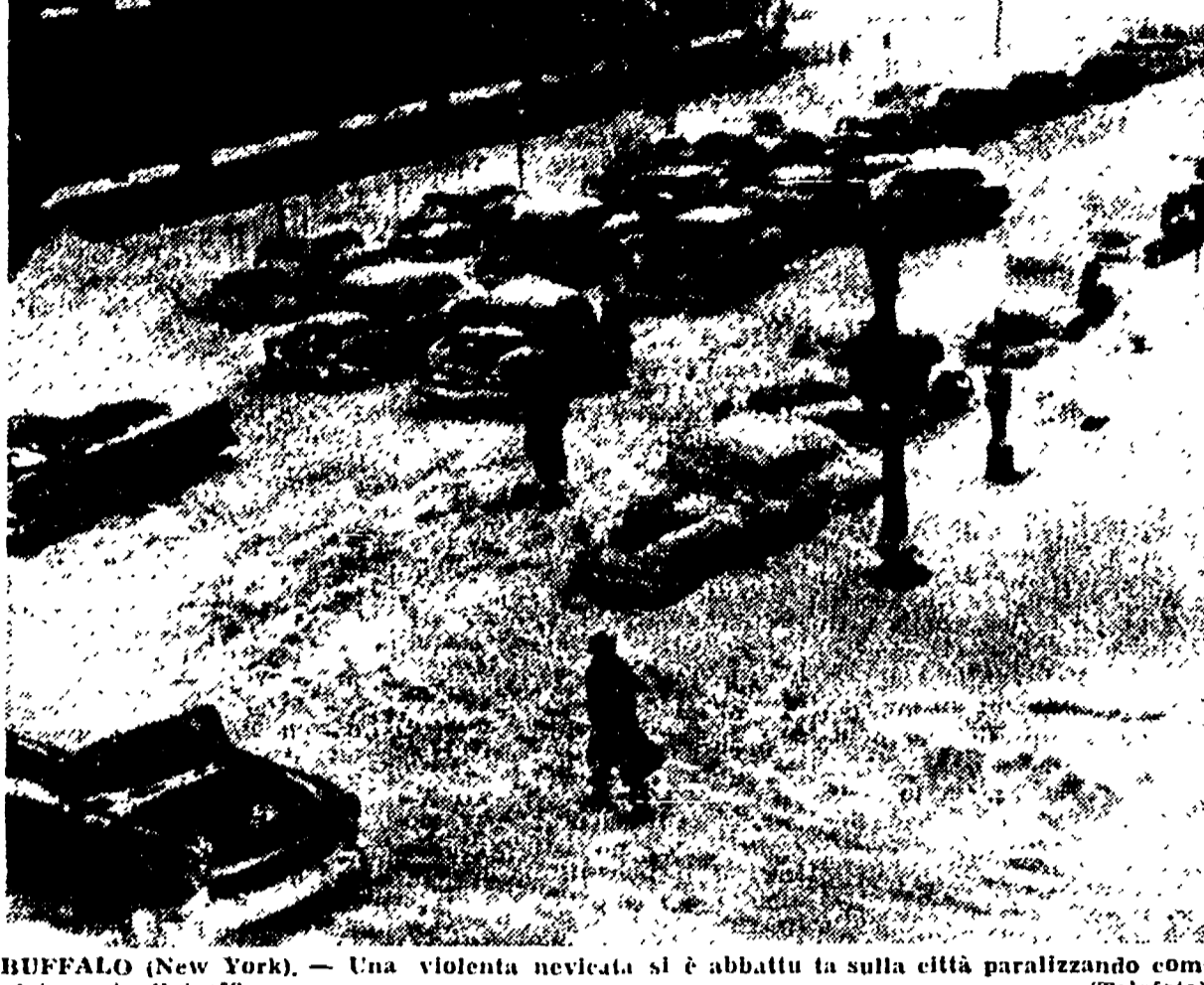
BUFFALO (New York). - Una violenta nevicata si è abbattuta sulla città paralizzando completamente il traffico.