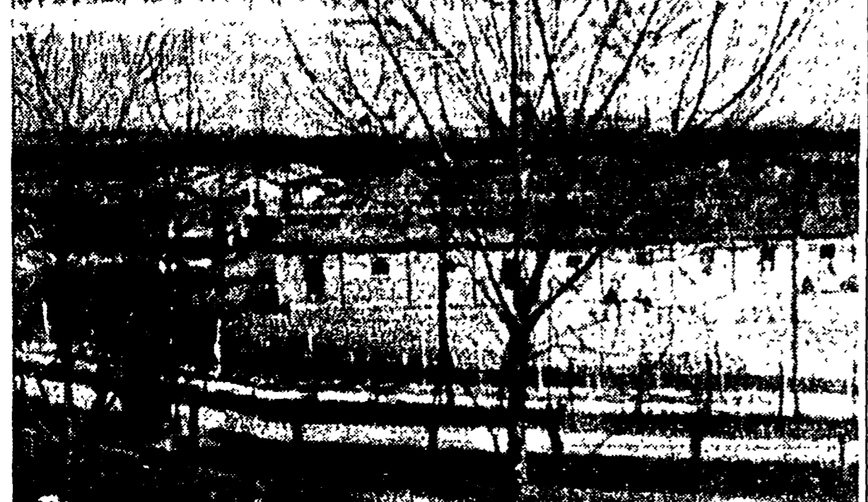
Un aspetto del campo di concentramento nazi-fascista di Fossoli