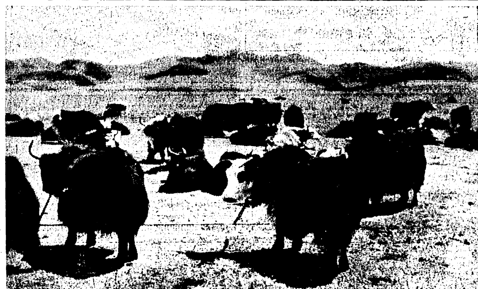
Una mandria di yak, i gibbosi buoi tibetani dal nero mantello, al pascolo nella prateria