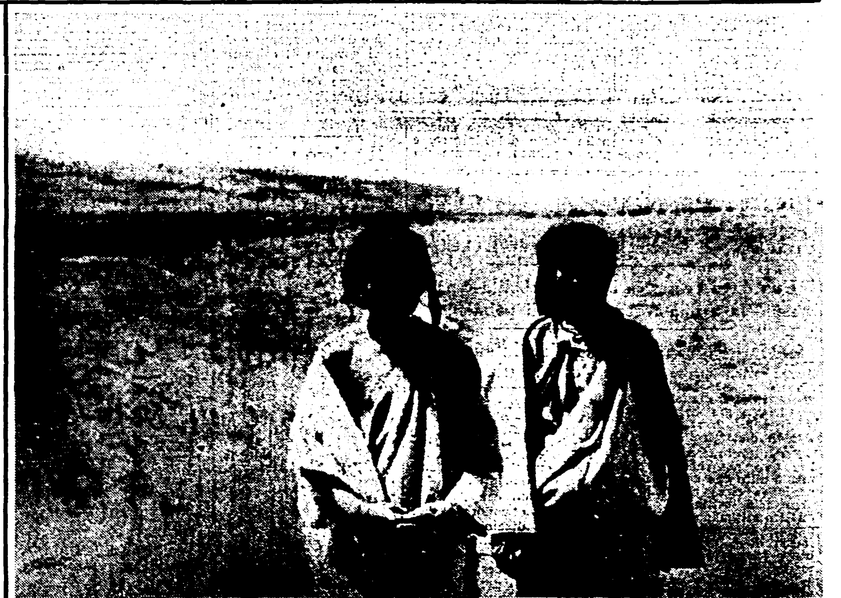
Due pastori tibetani fotografati in un pascolo su un vasto altopiano a 4000 metri d'altezza