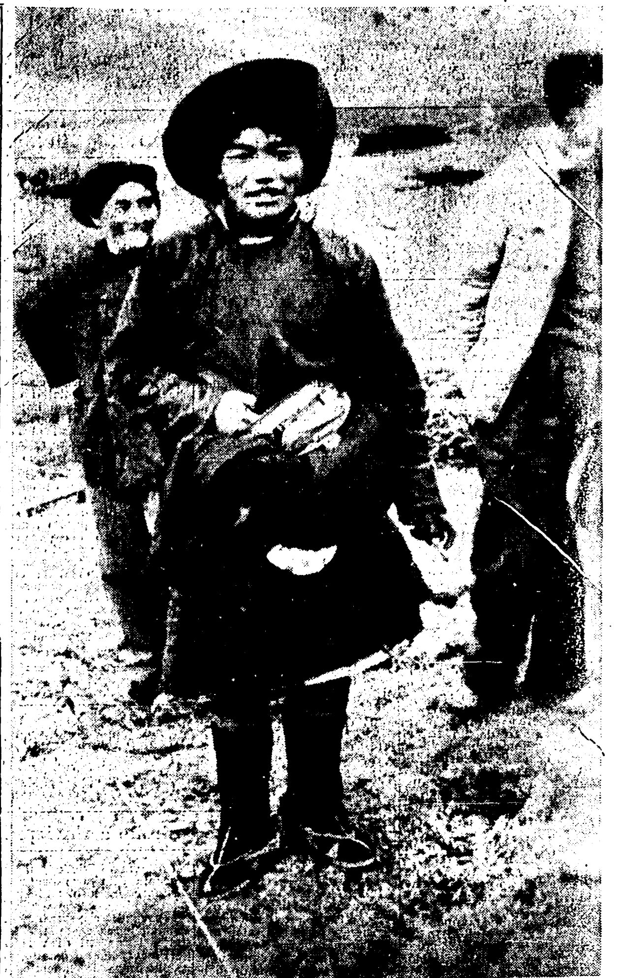
Un giovane mercante tibetano nel suo caratteristico costume