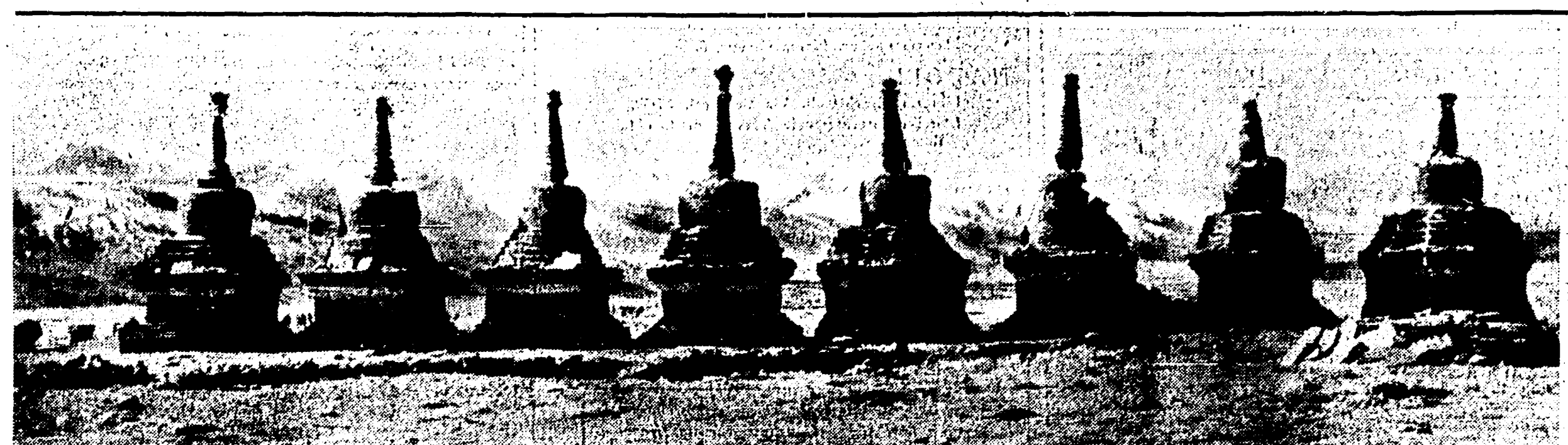
Fila di cérten, sorta di candidi tempietti in onore di Budda, entro i quali sono custodite reliquie e scritture sacre della religione lamaista