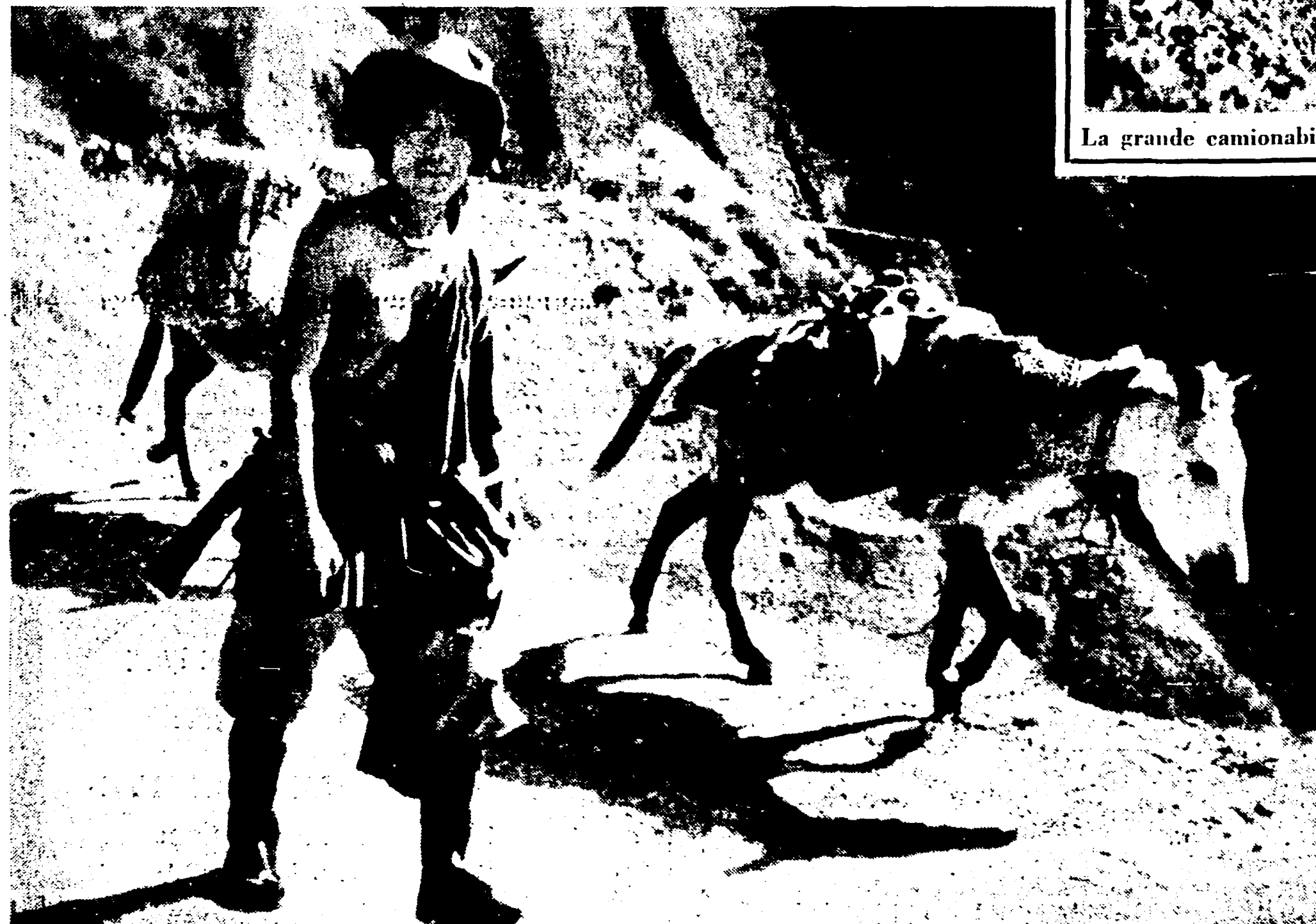
Il capo di una carovana di muli incontrato nella provincia di Szecciuan sulla strada che sovrasta l'impetuoso Mekong