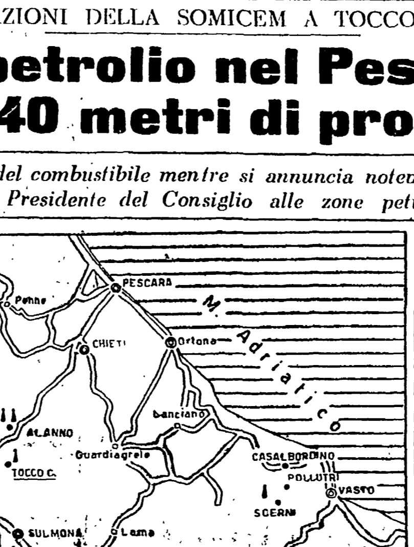
La zona di ricerca del petrolio nell'Abruzzo