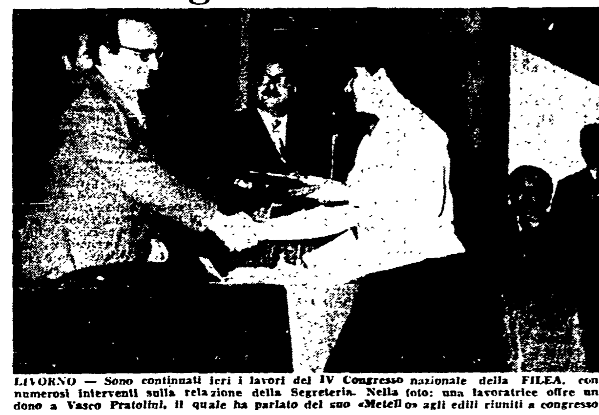
LIVORNO. — Sono conclusi ieri i lavori del IV Congresso nazionale della FIOT, con numerosi interventi sulla relazione del segretario. Nella foto: un lavoratore edile e una donna a Vasco Pratolini, il quale ha parlato del suo «metallo» agli edili riuniti al congresso.