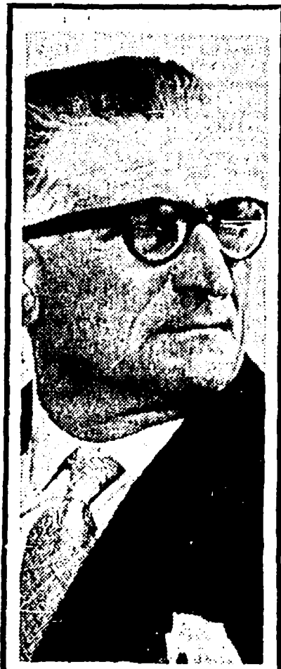
In quella specie di jungla che è il mondo delle due ruote Farina ha la vita difficile, tormentata. Il suo candore è sublime...

Intanto siamo sempre in attesa di sapere come sono andate le cose a proposito dello scandalo dei cinque milioni di franchi