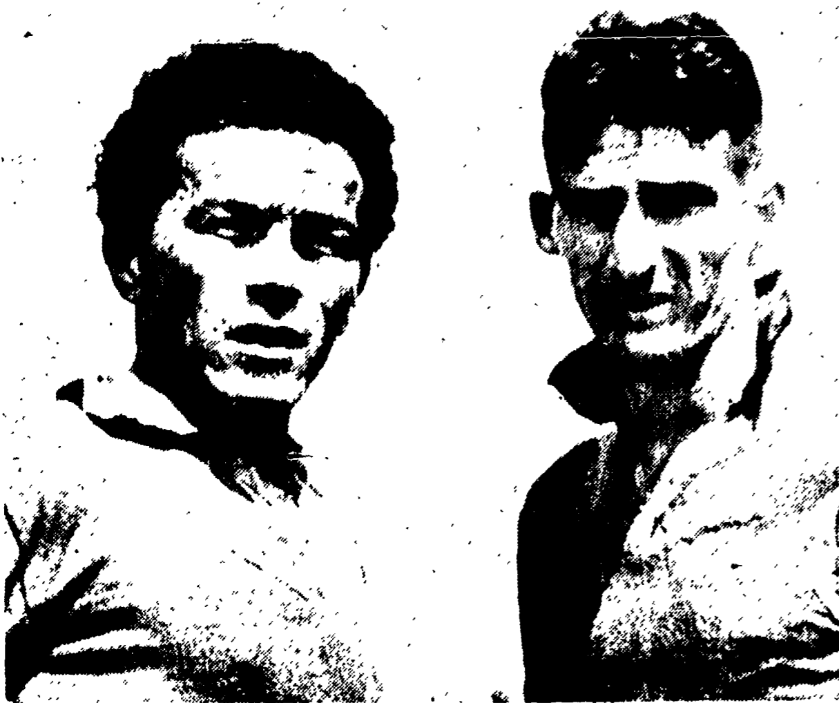
Mentre le inseguitrici sono da tempo impegnate, i «viola» rievocano in casa la Spal, Villa Faella, dunque, per la Fiorentina che attende buone notizie da Padova e da Milano

PREVISTO UN SECONDO SUCCESSO CASALINGO DEI BIANCAZZURRI