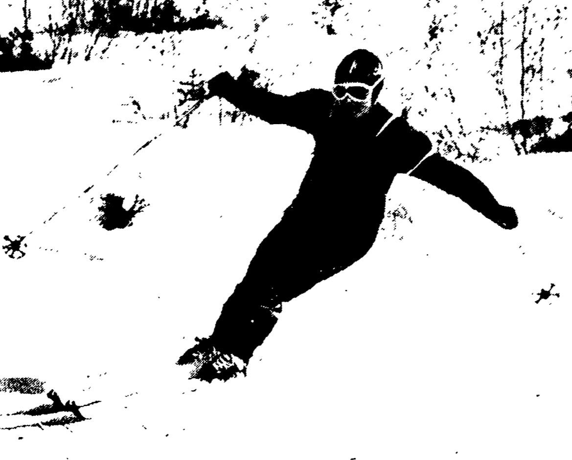
L'austraco ventenne TONI SAILER è uno dei favoriti per le prove olimpiche di discesa e slalom; venerdì scorso si impose a Wengen nella prova di discesa libera (migliorando il tempo record della pista con 2'16") e domenica si è classificato terzo nello slalom e secondo nella combinata alpina.