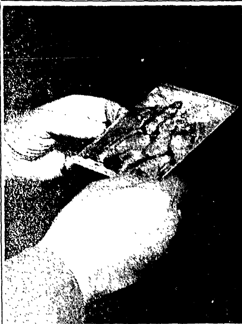
L'opera sennòscivola del Tifano sarebbe stata identificata in questo piccolo disegno a sanguigna diluita raffigurante la Madonna con due santi...