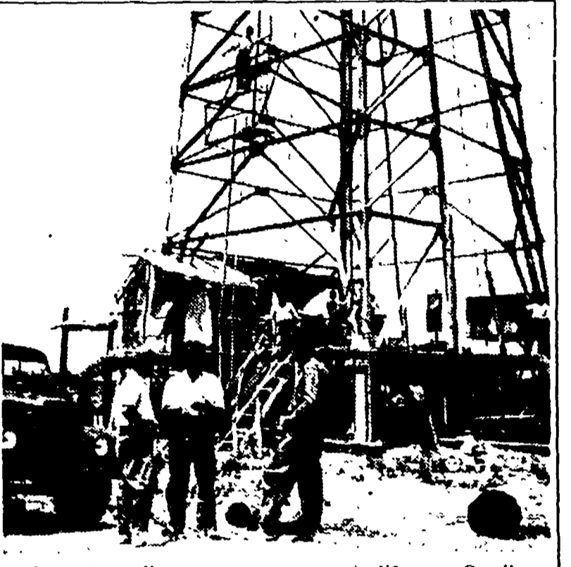
L'apertura di un nuovo pozzo petrolifero a Cerrik