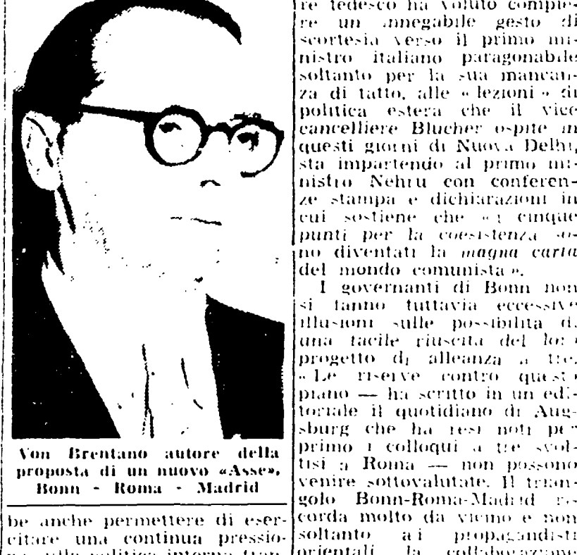
Von Brentano autore della proposta di un nuovo "Asse Roma - Bonn - Madrid"

LABORAZIONE tra Bonn, Roma e Madrid. Secondo indiscrezioni trapelate ad ambienti molto seri, si sono già tenute a Roma durante il soggiorno di von Brentano le conversazioni con i generali della Nato che sono molto più soddisfatte della Spagna, dell'Italia e della Repubblica federale di quanto non lo siano della Francia.