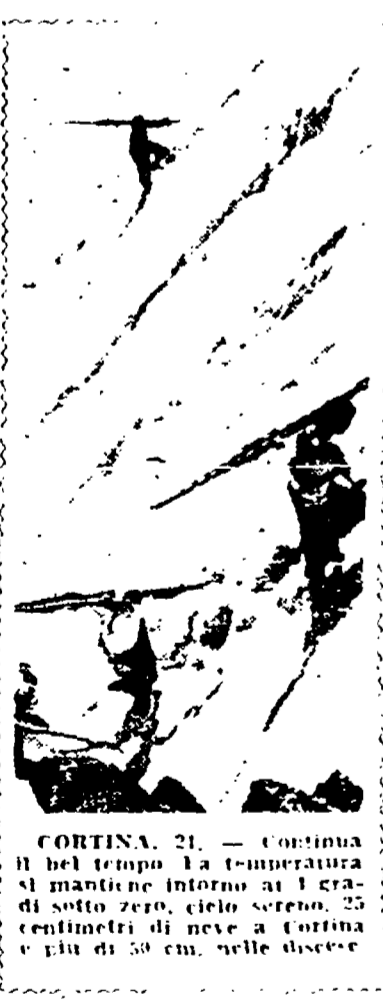
CORTINA 21. — Continua il forte tempo. La temperatura si mantiene intorno ai 10 gradi sotto zero, cielo sereno. 25 centimetri di neve, in forma di ghiaccio, sulle piste.