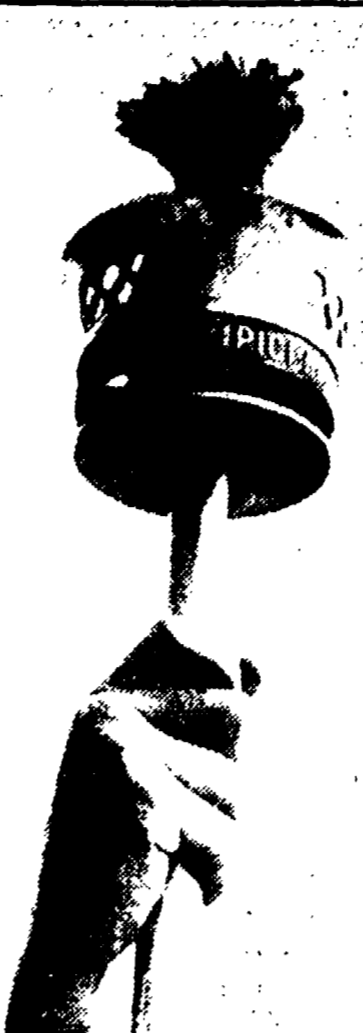
Questa mattina alle 11, avrà luogo in Campidoglio la solenne cerimonia di apertura della fiamma olimpica per l'Italia. Il primo atleta italiano sarà Adolfo Consolini.