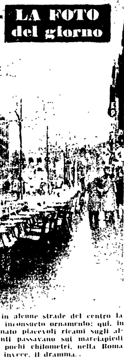
LE DUE CITTA' — Solo in alcune strade del centro la neve ha rappresentato un imponente spettacolo. In via Veneto, essa ha disegnato piacevoli ritmi sugli alberi, per la gioia di quanti passavano sui marciapiedi perfettamente sgomberi, nella Roma delle borgate e, invece, il dramma.