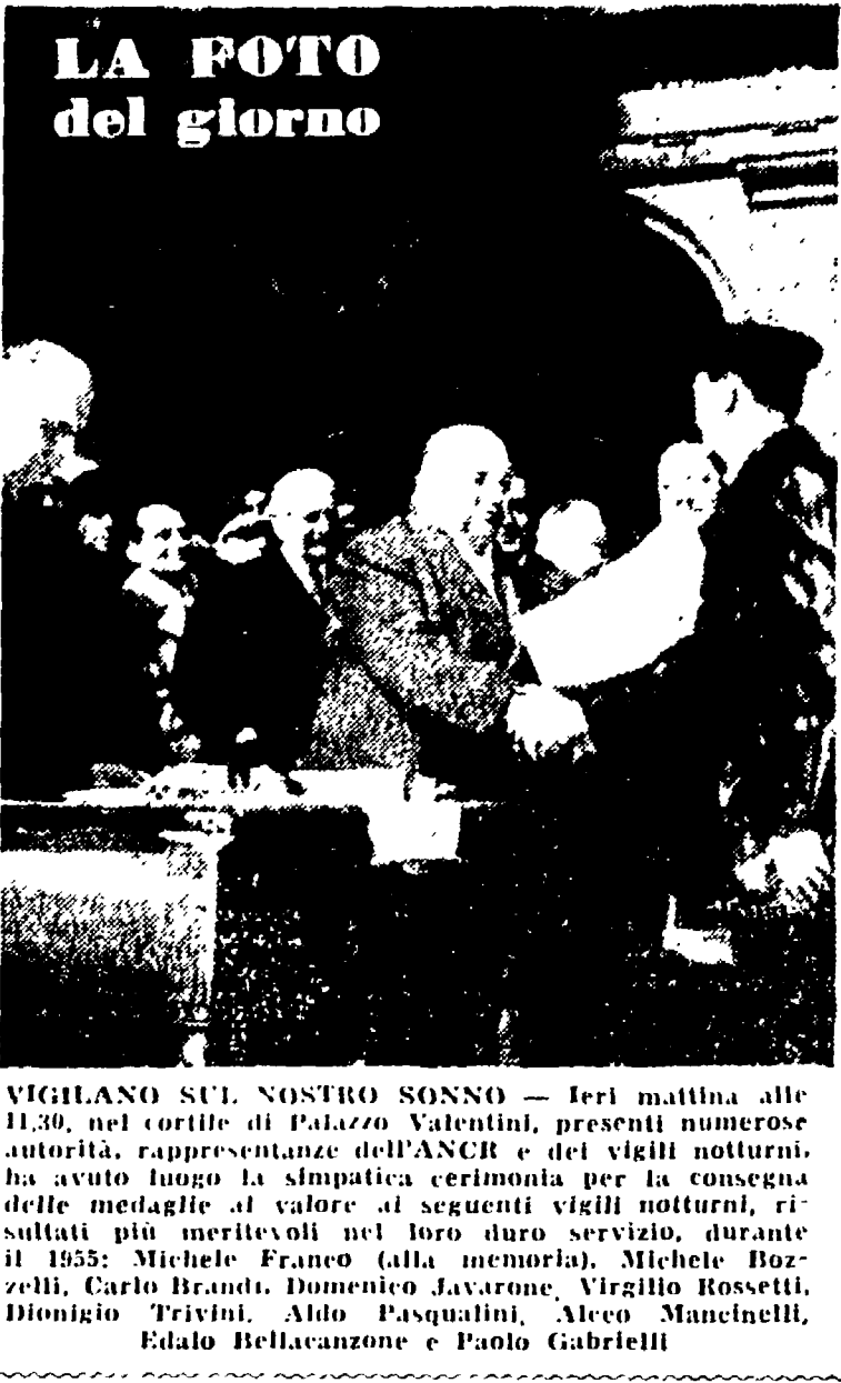
LA FOTO del giorno

Profondo è il malcontento... conversazioni di stasera sul congresso del PCUS